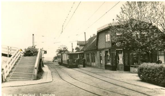
Broek in Waterland - Tramhalte

Voordat de Provinciale weg werd aangelegd werd het vervoer naar en van Amsterdam geregeld, eerst via de trekvaart en later door de stoomtram. Ja, u leest het goed, u staat nu op de oude tramhalte van de tramlijn Amsterdam-Volendam/Edam. In 1888 werd tot aanleg van de Noord-Hollandse stoomtram (NHT) besloten. Er wordt gekozen om de trambaan van Broek in Waterland naar Monnickendam aan de oostelijke zijde van de trekvaart aan te leggen. De heer Thomas Bijl Jz, eigenaar van de grond van de Eilandweg verkoopt in 1887 een reep grond langs de oever van de trekvaart en breekt zijn "buiten" af om het mogelijk te maken dat de tram richting Monnickendam kan. Hij bouwt een nieuw woonhuis annex wachtruimte en omdat hij ook het agentschap van de tram beheert wordt één raam aan de perronzijde voorzien van een kaartloket. Het loketje is er nog steeds. In het boek "de Waterlandse stoomtram" wordt het stationskoffiehuis als net en onderhouden omschreven.